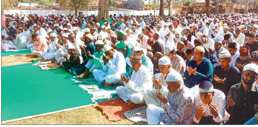
ईद की नमाज अता करते समाज के लोग।